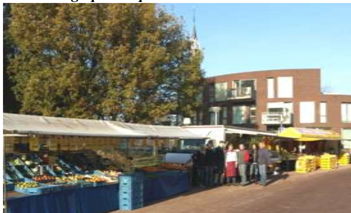
Na een aantal maanden gehuisvest te zijn geweest op het parkeerterrein naast RODA '23, is de markt terug op zijn oude plek in Bovenkerk-Centrum.