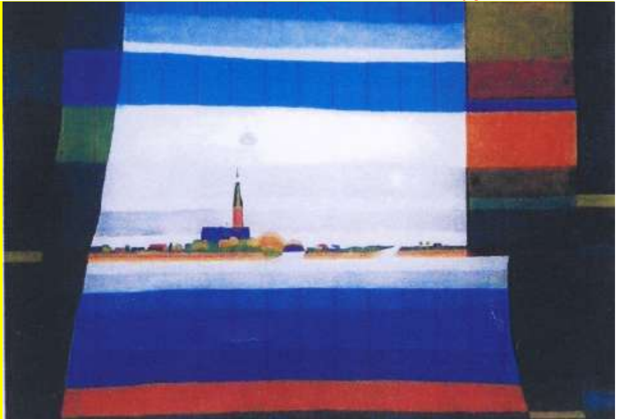
Illustratie: Sint Urbanus aan de Poel door Arie Dekker, 2008.