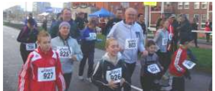
Bovenkerkse Kerstloop 2010.

Op tweede kerstdag laat burgemeester Jan van Zanen het startschot klinken voor de zeventiende kerstloop. Om 11 uur in de ochtend gaan honderden lopers en loopsters vanaf het RODA complex aan de Noorddammerweg hun conditie en snelheid beproeven op een bostraject naar keuze. Er zijn afstanden van 5 en 10 kilometer, terwijl de kinderen op een route van 2,5 kilometer gaan rennen. Het is een goeie traditie dat de sportverenigingen Rodaconditie en Startbaan op een van de Kerstdagen een gezellige en sportieve happening organiseren met veel kerstsfeer en vele leuke prijzen. Vorig jaar moest het evenement helaas vanwege de extreme weersomstandigheden op het laatste moment worden afgelast, maar dit keer wordt met de hulp van veel sponsors weer gewerkt aan een succesvolle recreatieloop. Aan de bewoners van Bovenkerk wordt gevraagd om een beetje rekening te houden met de meute hardlopers. Ter wille van de veiligheid worden delen van de Legmeerdijk en de Vierlingsbeeklaan korte tijd voor autoverkeer afgesloten. Bovenkerk blijft echter bereikbaar via Noorddammerlaan en Noorddammerweg. De organisatie zet vele vrijwilligers in om het verkeer in goede