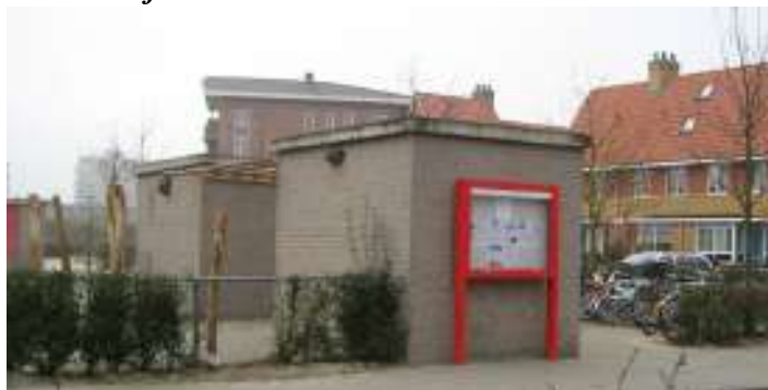
De nieuwe vitrine van het Bewonersplatform in Bovenkerk-Zuid aan de Ringslang naast de school.